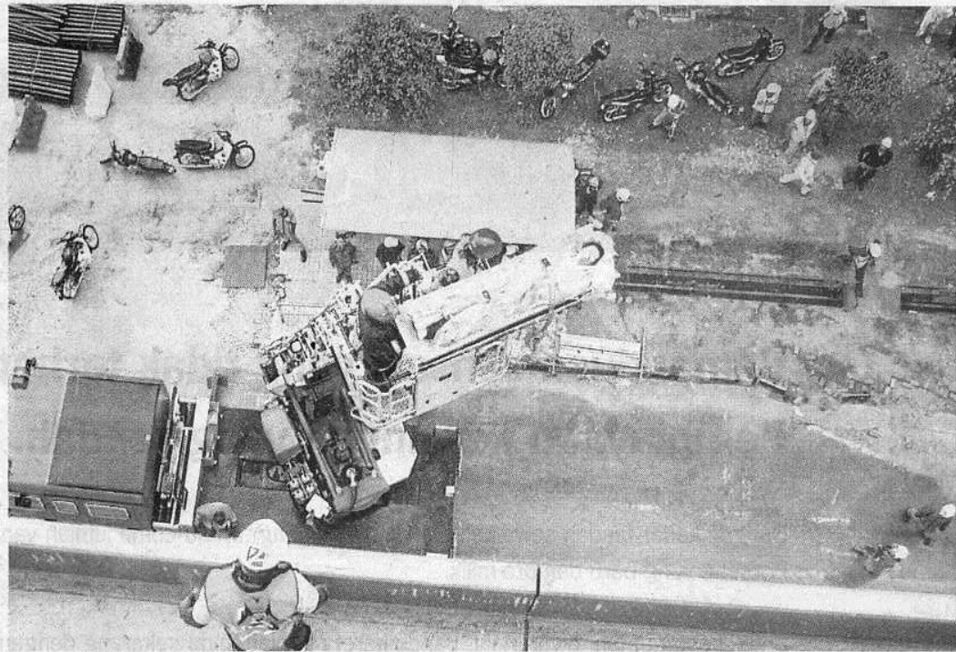
Operasi menyelamatkan mangsa yang tersepit di projek landasan MRT di Bandar Kinrara, Puchong, semalam.

"Orang ramai perlu memaklumkan sesuatu kejadian dengan segera kepada pasukan penyelamat bagi mengelak sesuatu lebih buruk berlaku," katanya ketika ditemui di lokasi