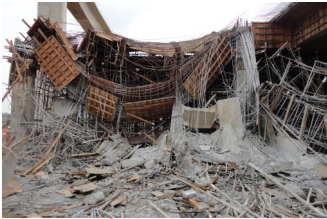
Keruntuhan struktur formwork-falsework semasa kerja penuangan konkrit.