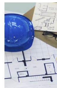
PE hendaklah mempunyai pengetahuan berkenaan kod rekabentuk yang relevan dan terkini.

berkenaan spesifikasi reka bentuk, prosedur pemasangan, pemeriksaan dan penanggulan. Di samping itu, penyelia formwork dan pemasang formwork , hendaklah diberi latihan supaya mereka arif berkenaan risiko dan memahami prosedur kerja selamat yang telah ditetapkan. Seksyen 17 dan 24 AKKP, serta Peraturan 4 BOWEC dengan jelas mewajibkan semua pihak bertanggungjawab ke atas keselamatan diri mereka dan orang lain yang mungkin terkesan daripada aktiviti kerja mereka.