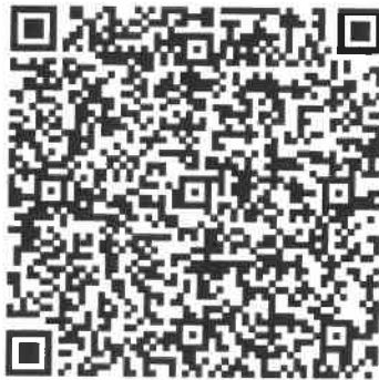
Rajah 1: QR code bagi Perintah Khas

Panduan ini dibangunkan untuk menerangkan pihak industri terutamanya pengurus berkenaan pelaksanaan Perintah Khas Ketua Pemeriksa Bilangan 1 Tahun 2020 Pengurusan Keselamatan Struktur Sementara (Perancah, Acuan dan Penyangga) . Perintah Khas ini juga boleh diakses menerusi laman sesawang jabatan atau QR code seperti di Rajah 1.