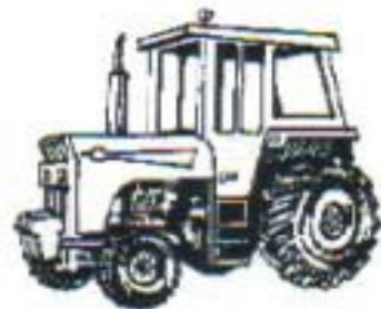
முழுதும் மூடப்பட்ட கூரை - கட்டுப்படுத்தப்பட்ட சுற்றுச்சூழல், கட்டுப்படுத்தப்பட்ட தட்பவெப்பம், சுகம் மற்றும் சத்தம்.