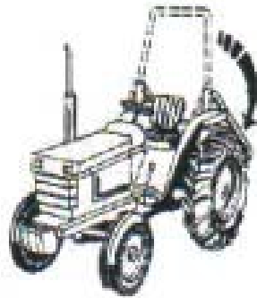
மடக்ககூடிய கம்பம் - பழத்தோட்டம் அல்லது எல்லைக்குட்பட்ட வேலைக்கு. உதாரணம், கூரையுள்ள வாகனம் நிறுத்துமிடம்