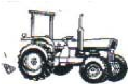
இரண்டு கம்பம் - திட்டமான பாதுகாப்பு பொதுவான வெளி களப்பணிக்கு

உருள் தடுப்பு பாதுகாப்பு அமைப்பு (ரோப்ஸ்) அல்லது பாதுகாப்பு கேப் ஆனது டிராக்டர் பக்கவாட்டில் உருளும்போது அல்லது பின்திரும்பி விழும்போது மரணம் அல்லது மோசமான காயம் ஏற்படுவதைத் தடுக்கும் ஒரே பாதுகாப்பாகும். மரத்தின்கீழ் அல்லது கீழ் நிலைக்கட்டிடங்கள் அருகே உபயோகிக்கப்படும் டிராக்டர்கள் வேலை முடிந்தபின் ரோப்ஸை இறக்கவோ அல்லது நீக்கவோ செய்யயலாம். விவசாய டிராக்டர்களுக்கு, ஆஸ்திரேலிய அளவுகோல் 1636 அல்லது ஆஸ்திரேலிய அளவுகோல் 2294 அல்லது எந்த அங்கீகரிக்கப்பட்ட அனைத்துலக அளவுகோல் கொண்ட ரோப்ஸ் அமைப்பு பயன்படுத்தப்படவேண்டும். உருளும் நிகழ்வின்போது பாரங்களைத் தாங்கும் சக்தி கொண்டதாக ரோப்ஸ் இருக்கவேண்டும்.