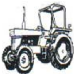
மடக்ககூடிய கம்பம் - பழத்தோட்டம் அல்லது எல்லைக்குட்பட்ட வேலைக்கு. உதாரணம், கூரையுள்ள வாகனம் நிறுத்துமிடம்